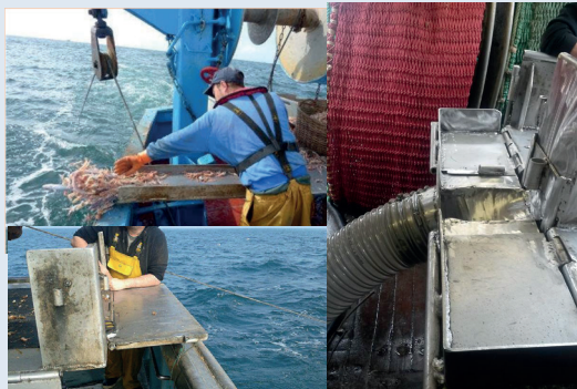
Goulotte et table de tri sur un langoustinier

Maximiser les chances de survie des captures de juvéniles Les tables de tri et goulotte installées sur les chalutiers français pêchant la langoustine dans le Golfe de Gascogne ont permis d'améliorer le taux de survie des langoustines relâchées.