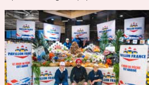
Hyper Leclerc Quimperlé (29)