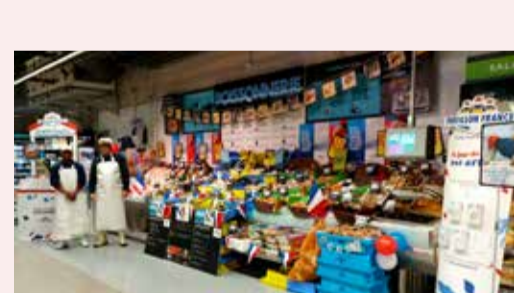
Super Casino Bagneux (92)

Les inscriptions sont ouvertes jusqu'au 30 novembre !